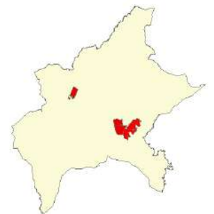
ÁREA TRATADA - MUNICÍPIO DE GOIÂNIA

ArcMap Versão 10.3 DATUM SIRGAS 2000 Coordenadas UTM, fuso 22K Município de Goiânia