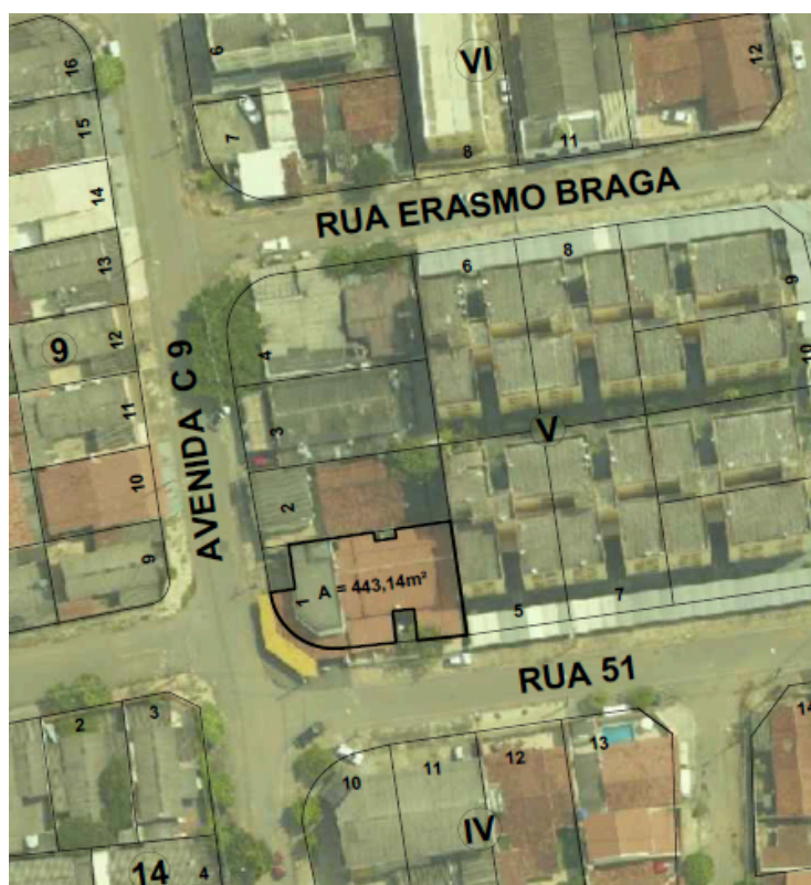
Figura 02– Recorte ampliado do Sistema de Informações Geográficas de Goiânia – SIGGO