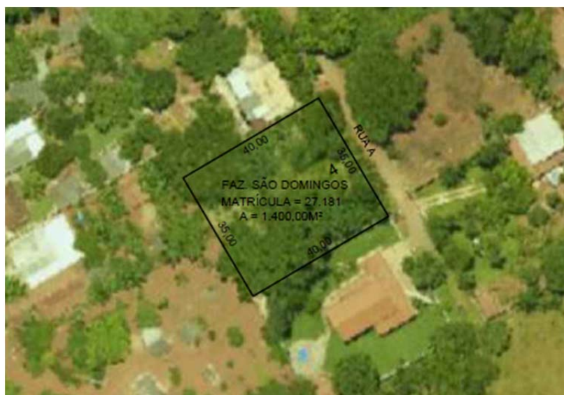
FIG.: 01 - RECORTE DO SISTEMA DE INFORMAÇÕES GEOGRÁFICAS DE GOIÂNIA – SIGGO.

De acordo com as informações obtidas no Sistema de Informações Geográficas de Goiânia – SIGGO, figura 01, de uma parte de terra destacada da área maior, situada na Fazenda São Domingos, em Goiânia, com área total de 1.400,00m 2 , Matrícula n.º 27.181 da 2ª Circunscrição de Registro de Imóveis , encontra-se situado na Macrozona Construída , por força da Lei Complementar N.º 349, de 04 de março de 2022.