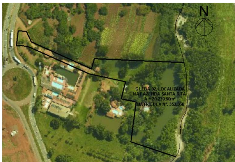
FIG.: 01 - RECORTE DO SISTEMA DE INFORMAÇÕES GEOGRÁFICAS DE GOIÂNIA – SIGGO.

De acordo com as informações obtidas no Sistema de Informações Geográficas de Goiânia – SIGGO, figura 01, Gleba 02 localizada na Fazenda Santa Rita , em Goiânia, com área total de 20.239,60 m 2 , Matrícula n.º 353.360 da 1ª Circunscrição de Registro de Imóveis , encontra-se situado na Macrozona Construída , por força da Lei Complementar N.º 349, de 04 de março de 2022.