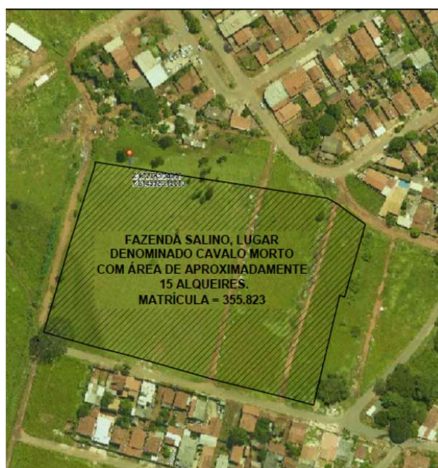
FIG.: 01 - RECORTE DO SISTEMA DE INFORMAÇÕES GEOGRÁFICAS DE GOIÂNIA – SIGGO.

De acordo com as informações obtidas no Sistema de Informações Geográficas de Goiânia – SIGGO, figura 01, Fazenda Salino, lugar denominado Cavalo Morto, neste Município, com área de aproximadamente 15 alqueires, Matrícula n.º 355.823 da 1ª Circunscrição de Registro de Imóveis , encontra-se situado na Macrozona Construída , por força da Lei Complementar N.º 349, de 04 de março de 2022.