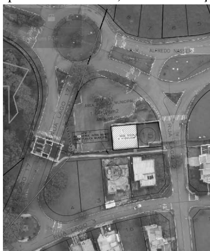
FIG.: 01 - RECORTE DO SISTEMA DE INFORMAÇÕES GEOGRÁFICA DE GOIÂNIA – SIGGO.

Para fins de análise e comprovação, atendendo a Lei Complementar nº 314 de 05 de novembro de 2018, Artigo 2º, VIII, certificamos que após análise da Ortofoto 2016 , constatamos a existência de edificação no Lote 01, Quadra 15, na Rua do Lago 2, no Condomínio do Lago 1ª etapa , nesta Capital, com área visível construída de 240,00m² aproximadamente , conforme pode verificar no croqui anexo sobreposto à referida imagem, o lote em questão encontra-se situado na Macrozona Construída , por força da Lei Complementar N.º 349, de 04 de março de 2022.