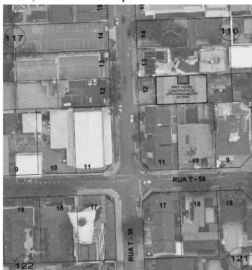
FIG.: 01 - RECORTE DO SISTEMA DE INFORMAÇÕES GEOGRÁFICAS DE GOIÂNIA – SIGGO.

Para fins de análise e comprovação, atendendo a Lei Complementar nº 314 de 05 de novembro de 2018, Artigo 2º, VIII, certificamos que após análise da Ortofoto 2016 , constatamos a existência de edificação no Lote 12, Quadra 116, na Rua T - 38, no Setor Bueno , nesta Capital, com área visível construída de 381,60m 2 aproximadamente , conforme pode verificar no croqui anexo sobreposto à referida imagem, o lote em questão encontra-se situado na Macrozona Construída , por força da Lei Complementar N.º 349, de 04 de março de 2022.