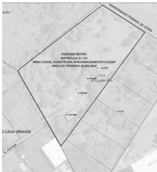
FIG.: 01 - RECORTE DO SISTEMA DE INFORMAÇÕES GEOGRÁFICA DE GOIÂNIA – SIGGO.

Para fins de análise e comprovação, atendendo a Lei Complementar nº 314 de 05 de novembro de 2018, Artigo 2º, VIII, certificamos que após análise da Ortofoto 2016 , constatamos a existência de edificação na Fazenda Retiro , nesta Capital, com área total de 30.000,00 m², Matrícula n.º 21.143 da 2ª Circunscrição de Registro de Imóveis, com área visível construída de 615,62 m² aproximadamente , conforme pode verificar no croqui anexo sobreposto à referida imagem.