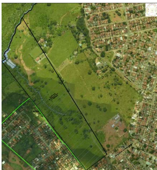
FIG.: 01 - RECORTE DO SISTEMA DE INFORMAÇÕES GEOGRÁFICA DE GOIÂNIA – SIGGO.

De acordo com as informações obtidas no Sistema de Informações Geográficas de Goiânia – SIGGO, figura 01, uma Gleba de Terras denominada Gleba “03” situada na Fazenda Ladeira, neste Município, com área total de 14ha52a00ca, Matrícula nº 14.477 da 3ª Circunscrição de Goiânia , encontra-se situado na Macrozona Construída , por força da Lei Complementar nº 349 de 04/03/2022.