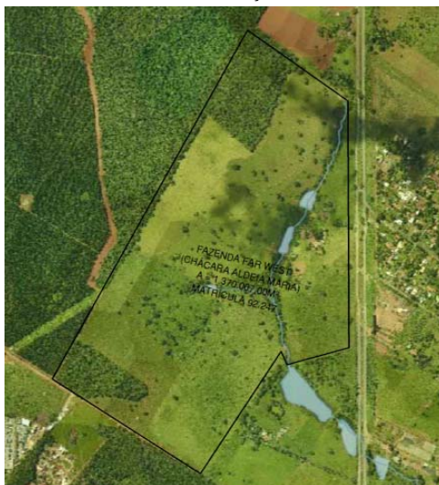
FIG.: 01 - RECORTE DO SISTEMA DE INFORMAÇÕES GEOGRÁFICAS DE GOIÂNIA – SIGGO.

De acordo com as informações obtidas no Sistema de Informações Geográficas de Goiânia – SIGGO, figura 01, a Fazenda FAR WEST – (Chácara Aldeia Maria), neste Município, com área total de 1.370.067,00m², Matrícula n.º 92.247 da 2ª Circunscrição de Registro de Imóveis , encontra-se situado na Macrozona Rural do Capivara – Outorga Onerosa de Alteração de Uso , por força da Lei Complementar N.º 349, de 04 de março de 2022.