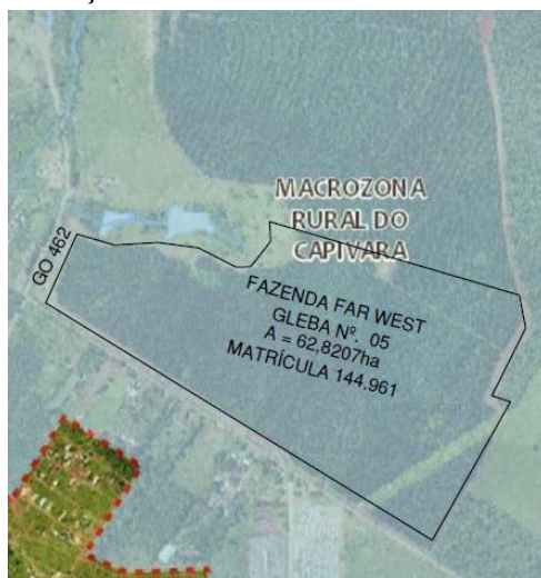
FIG.: 01 - RECORTE DO SISTEMA DE INFORMAÇÕES GEOGRÁFICAS DE GOIÂNIA – SIGGO.

De acordo com as informações obtidas no Sistema de Informações Geográficas de Goiânia – SIGGO, figura 01, a – Gleba 05 – Fazenda Far West, neste Município, com área total de 62,8207 ha, Matrícula n.º 144.961 da 2ª Circunscrição de Registro de Imóveis , encontra-se situado na Macrozona Rural do Capiwara – Outorga Onerosa de Alteração de Uso , por força da Lei Complementar N.º 349, de 04 de março de 2022.