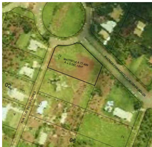
FIG.: 01 - RECORTE DO SISTEMA DE INFORMAÇÕES GEOGRÁFICAS DE GOIÂNIA – SIGGO.

De acordo com as informações obtidas no Sistema de Informações Geográficas de Goiânia – SIGGO, figura 01, o lote 12 da quadra 06, situado à Rua dos Beija-Flôres, no loteamento denominado Sítios de Recreio Paraíso Tropical, neste Município, com área total de 5.587,12m², Matrícula n.º 77.489 da 2ª Circunscrição de Registro de Imóveis , encontra-se situado na Macrozona Rural do Capivara – Outorga Onerosa de Alteração de Uso , por força da Lei Complementar N.º 349, de 04 de março de 2022.