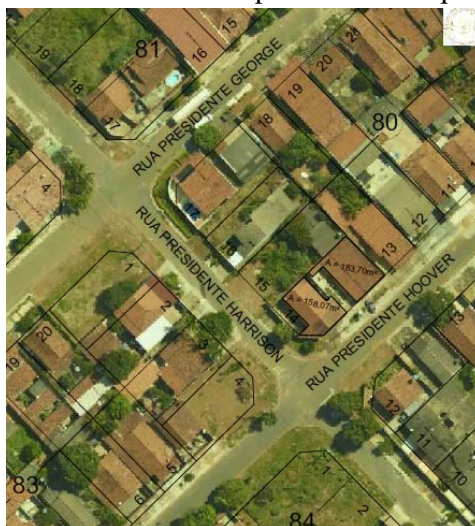
FIG: 01 - RECORTE DO SISTEMA DE INFORMAÇÕES GEOGRÁFICA DE GOIÂNIA – SIGGO.

Para fins de análise e comprovação, atendendo a Lei Complementar nº 314 de 05 de novembro de 2018, Artigo 2º, VIII, certificamos que após análise da Ortofoto 2016 , constatamos a existência de edificação no lote 14, quadra 80, na Rua Presidente Harrison, esquina com Rua Presidente Hoover, no Jardim Presidente , nesta Capital, com área visível construída de 341,77m² aproximadamente , conforme pode verificar no croqui anexo sobreposto à referida imagem.