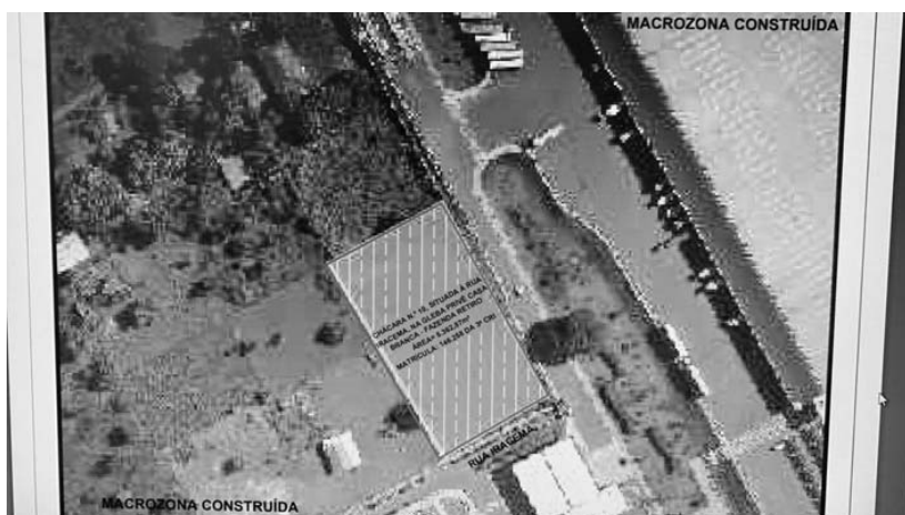
FIG.: 01 - RECORTE DO SISTEMA DE INFORMAÇÕES GEOGRÁFICA DE GOIÂNIA – SIGGO.

De acordo com as informações obtidas no Sistema de Informações Geográficas de Goiânia – SIGGO, figura 01, Chácara n.º 10, situada à Rua Iracema, na Gleba Privê Casa Branca, situada na Fazenda Retiro, neste Município, com área total de 5.362,87m 2 , Matrícula n.º 146.258 da 2ª CRI, encontra-se situado na Macrozona Construída , por força da Lei Complementar N.º 349, de 04 de março de 2022.