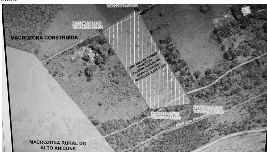
FIG.: 01 - RECORTE DO SISTEMA DE INFORMAÇÕES GEOGRÁFICAS DE GOIÂNIA – SIGGO.

De acordo com as informações obtidas no Sistema de Informações Geográficas de Goiânia – SIGGO, figura 01, e Levantamento Topográfico realizado pelo Técnico em Agrimensura Afonso Alves de Deus, uma Área de Terras, situada na Fazenda Forquilha, neste Município, com área total de 27.155,32m 2 , Matrícula n.º 6.939 da 1ª CRI , encontra-se situado na Macrozona Construída , por força da Lei Complementar N.º 349, de 04 de março de 2022.