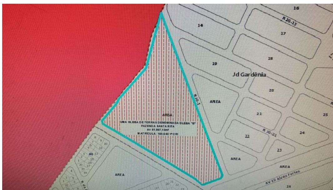
FIG.: 01 - RECORTE DO SISTEMA DE INFORMAÇÕES GEOGRÁFICA DE GOIÂNIA – SIGGO. GERÊNCIA DE DOCUMENTAÇÃO, CARTOGRAFIA E TOPOGRAFIA DA SECRETARIA MUNICIPAL DE PLANEJAMENTO URBANO E HABITAÇÃO.

De acordo com as informações obtidas no Sistema de Informações Geográfica de Goiânia – SIGGO, figura 01, uma Gleba de Terras denominada Gleba “B”, situada na Fazenda Santa Rita, neste Município, com área total de 61.997,10m 2 , Matrícula nº 150.548 da 1ª CRI , encontra-se situado na Macrozona Construída , por força da Lei Complementar nº 349 de 04/03/2022.