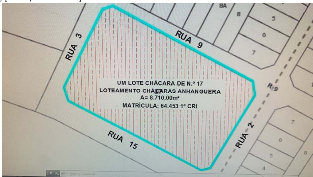
FIG.: 01 - RECORTE DO SISTEMA DE INFORMAÇÕES GEOGRÁFICAS DE GOIÂNIA – SIGGO.

De acordo com as informações obtidas no Sistema de Informações Geográficas de Goiânia – SIGGO, figura 01, um Lote Chácara de n.º 17, situada à Rua 2, Rua 3, Rua 9 e Rua 15, neste Município, com área total de 8.710,00m², Matrícula nº 64.453 da 1ª CRI, encontra-se situado na Macrozona Construída , por força da Lei Complementar nº 171 de 29/05/2007.