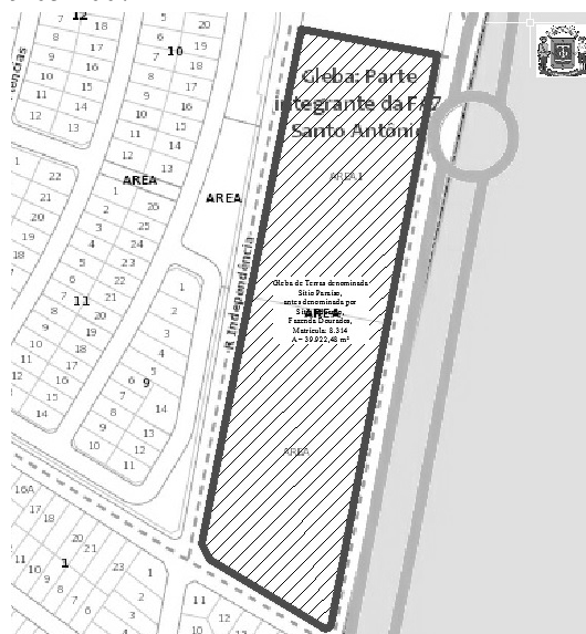
FIG.: 01 - RECORTE DO SISTEMA DE INFORMAÇÕES GEOGRÁFICAS DE GOIÂNIA – SIGGO.

De acordo com as informações obtidas no Sistema de Informações Geográficas de Goiânia – SIGGO, figura 01, uma Gleba de Terras denominada Sítio Paraíso, antes denominada por Sítio Eduardo, situada na Fazenda Dourados, neste Município, com área de 39.922,48 m 2 , de acordo com ART n.º 1020220124955, Matrícula nº 8.314 da 1ª CRI, encontra-se situado na Macrozona Construída , por força da Lei Complementar nº 171 de 29/05/2007.