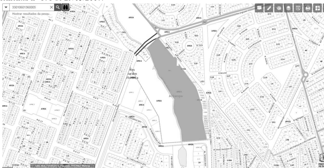
FIG. 01 - RECORTE DO SISTEMA DE INFORMAÇÕES GEOGRÁFICAS DE GOIÂNIA – SIGGO.

De acordo com as informações obtidas no Sistema de Informações Geográficas de Goiânia – SIGGO, figura 01, uma Gleba de Terras N.º 02, situada na Fazenda Santa Rita , entre os bairros Jardim Europa, jardins Florença e Setor Novo Horizonte, sito às Avenidas Berlim e Itália, neste Município, com área de 53.976,54 m², Matrícula nº 198.243 da 1ª CRI , encontra-se situado na Macrozona Construída , por força da Lei Complementar nº 171 de 29/05/2007.