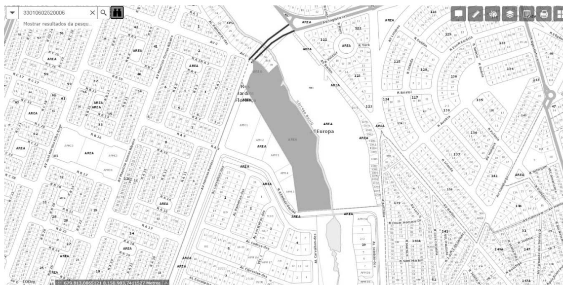
FIG: 01 - RECORTE DO SISTEMA DE INFORMAÇÕES GEOGRÁFICAS DE GOIÂNIA – SIGGO.

De acordo com as informações obtidas no Sistema de Informações Geográficas de Goiânia – SIGGO, figura 01, uma Gleba de Terras N.º 01, situada na Fazenda Santa Rita , entre os bairros Jardim Europa, Jardins Florença e Setor Novo Horizonte, sito a Avenida Hermes Pontes e com quem é de direito, neste Município, com área de 40.950,46 m², Matrícula nº 198.242 da 1ª CRI , encontra-se situado na Macrozona Construída , por força da Lei Complementar nº 171 de 29/05/2007.