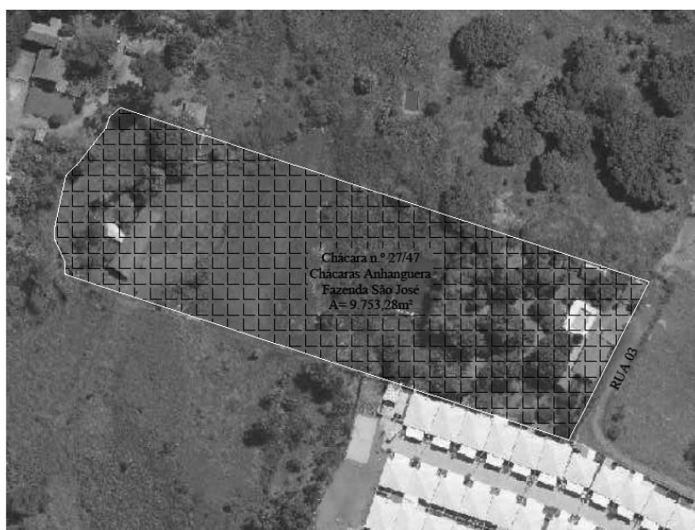
FIG: 01 - RECORTE DO SISTEMA DE INFORMAÇÕES GEOGRÁFICAS DE GOIÂNIA – SIGGO.

De acordo com as informações obtidas no Sistema de Informações Geográficas de Goiânia – SIGGO, figura 01, Chácara n.º 27/47, loteamento denominado Chácaras Anhanguera, situada na Fazenda São José , neste Município, com área total de 9.753,28 m² , Matrícula nº 73.673 da 1ª CRI , encontra-se situado na Macrozona Construída , por força da Lei Complementar nº 171 de 29/05/2007.