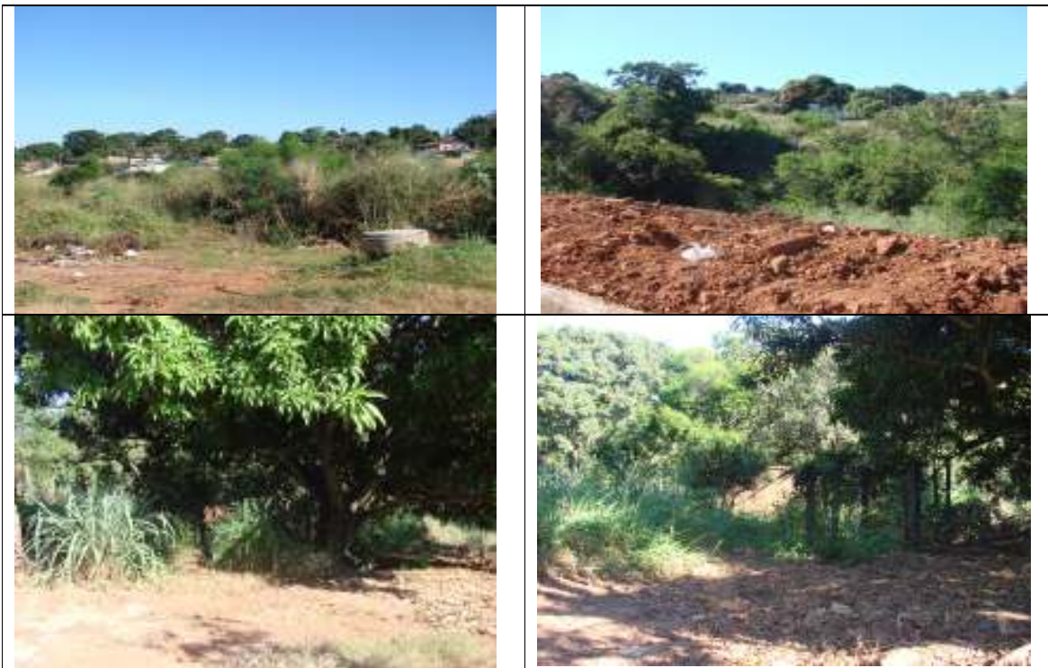
Figuras 02, 03, 04, 05, 06 e 07 – Situação atual da APP, onde as fotos 02 e 03 ilustram a cabeceira da APP da nascente ocupada e a presença absoluta da espécie invasora leucena, as figuras 04 e 05 ilustram a APP da faixa bilateral, à jusante das casas a serem removidas e as figuras 06 e 07 ilustra a presença de espécies exóticas frutíferas na APP remanescente.

23.6. É sabido portanto que a Lei nº. 171 de 21 de maio de 2007 que institui o Plano Diretor de Goiânia prevê que são consideradas Áreas de Preservação Permanente: