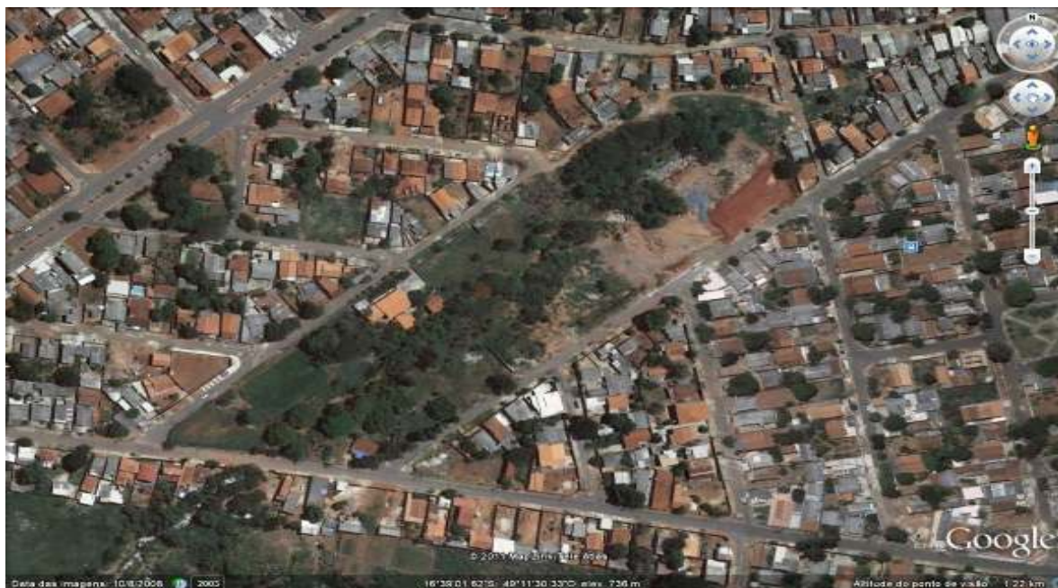
Figura 01 - Rua Gabriel Neto Amarante, Av. D. Serafim G. Jardim e Rua Prof. Augusto de Pádua, na Vila Santa Hilário