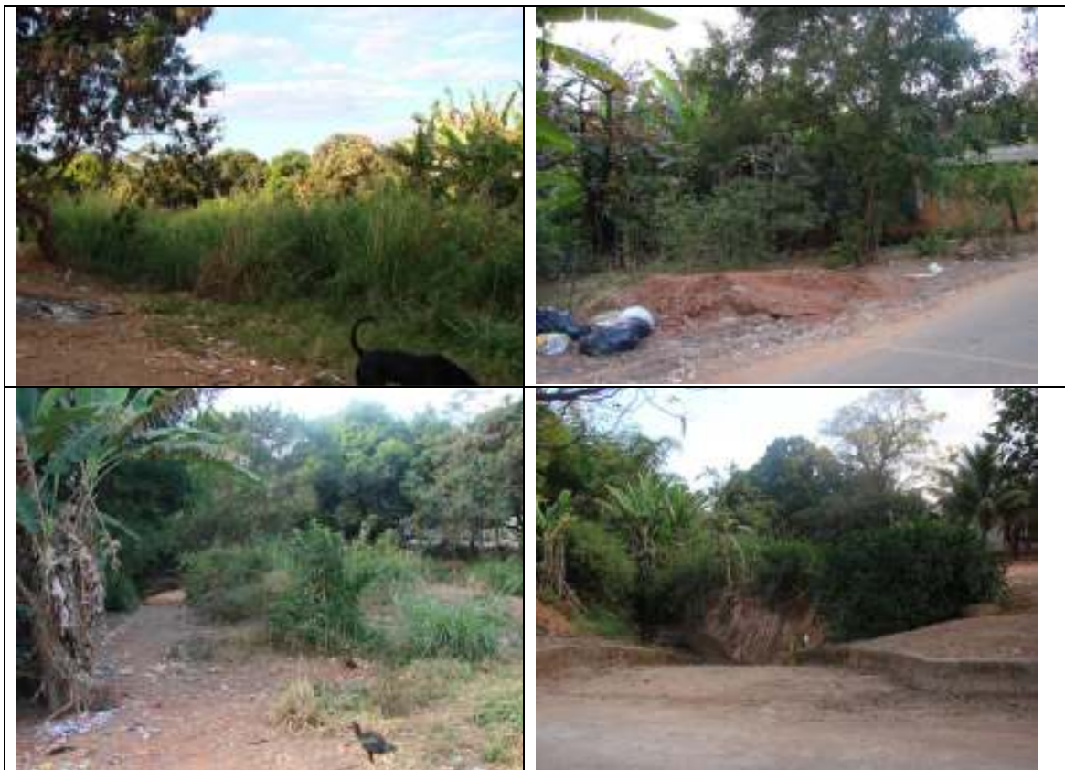
Figuras 02 e 03 – Imagens da APP da margem esquerda e margem direita do córrego Palmito na área a reflorestar onde há predomínio de espécies exóticas. Figuras 05 e 06 – Situação no interior da APP a revegetar.

02, 03, 04 e 05 permitem constatar que a vegetação na referida área não é aquela vegetação nativa e pretérita, e sim uma vegetação predominantemente exótica e introduzida na área após a ocupação da mesma como área residencial.