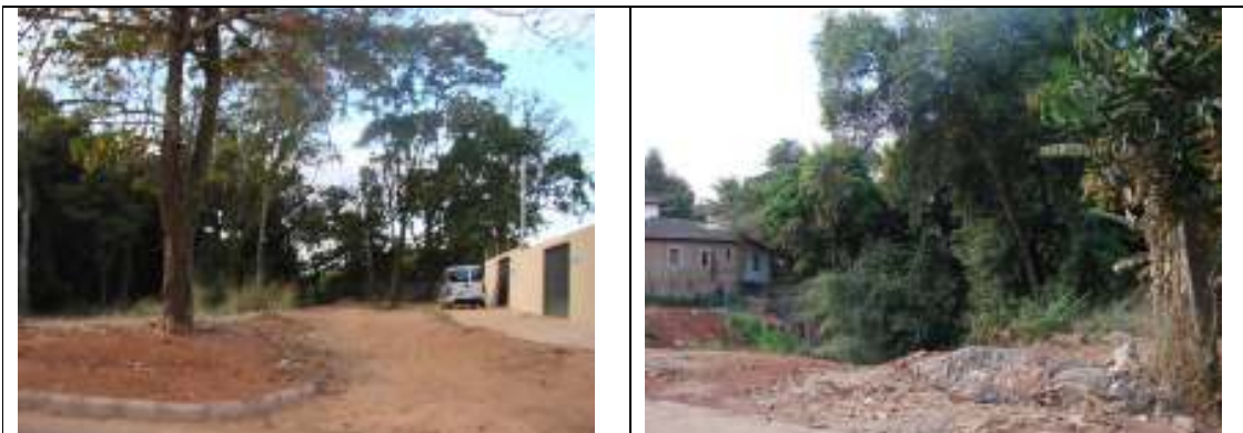
Figuras 06 e 07 – Imagem da APP a jusante da área a reflorestar, onde ainda há espécies nativas remanescentes na Mata de Galeria.

28.5.5. É sabido portanto que a Lei nº. 171 de 21 de maio de 2007 que institui o Plano Diretor de Goiânia prevê que são consideradas Áreas de Preservação Permanente: