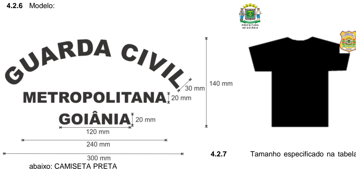
4.2.7 Tamanho especificado na tabela