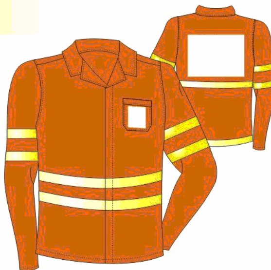
TABELA DE MEDIDA PARA PEÇAS PRONTAS (JALECO)

Embalagem: As peças devem ser acondicionadas em sacos plásticos, individuais, com numeração visível; embalagem coletiva, em caixa de papelão com as devidas identificações.