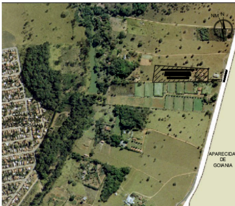
Recorte Do Sistema De Informações Geográfica De Goiânia – SIGGO.