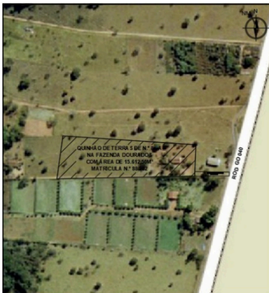
Recorte Do Sistema De Informações Geográfica De Goiânia – SIGGO.