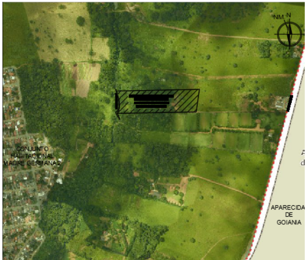
Recorte Do Sistema De Informações Geográfica De Goiânia – SIGGO.