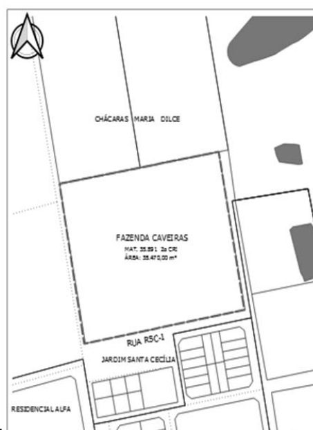
FIG. 01 - RECORTE DO SISTEMA DE INFORMAÇÕES GEOGRÁFICAS DE GOIÂNIA – SIGGO.

De acordo com as informações obtidas no Sistema de Informações Geográficas de Goiânia – SIGGO, figura 01, Fazenda Caveiras , neste Município, com área total de 35.470,00 m 2 , Matrícula nº 35.891 da 2ª CRI , Cadastro Imobiliário 420.137.025.8000 encontra-se situado na Macrozona Construída , por força da Lei Complementar nº 171 de 29/05/2007.