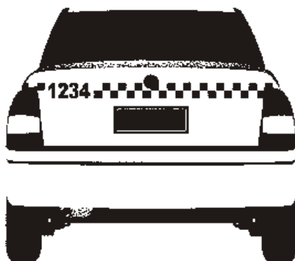
Figura 02.c: 3.ª opção