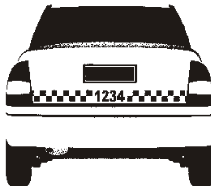
Figura 02.b: 2.ª opção