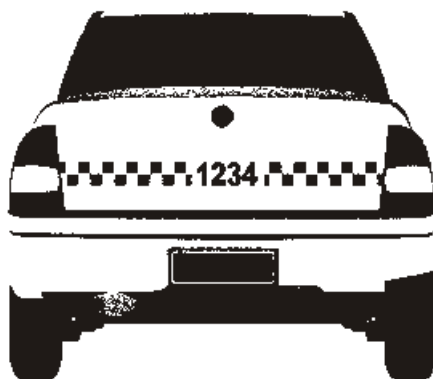
Figura 02.a: 1.ª opção